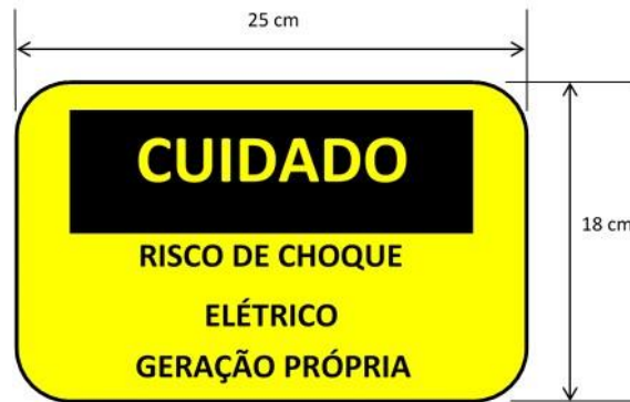
Figura 3: Placa de advertência.