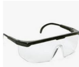
Óculos de segurança