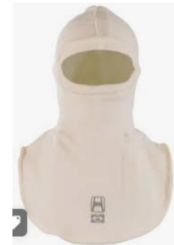
Capuz de segurança contra arco elétrico