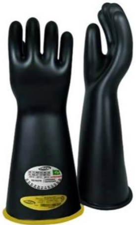
Luva isolante de borracha