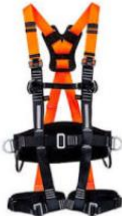
Cinto de segurança