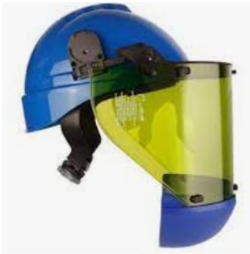
Protetor facial com arco elétrico