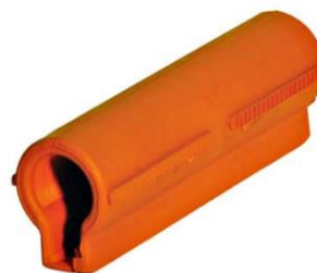
CONECTOR PARA COBERTURA TIPO MANGUEIRA FLEXÍVEL