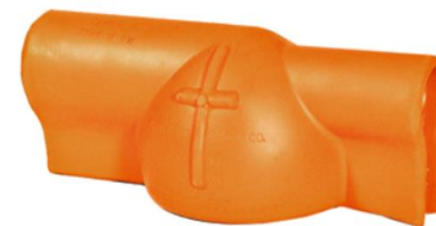
COBERTURA DE BORRACHA PARA ISOLADOR DE PINO