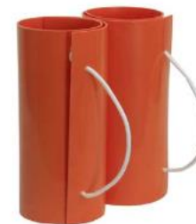
COBERTURA ISOLANTE PARA POSTE